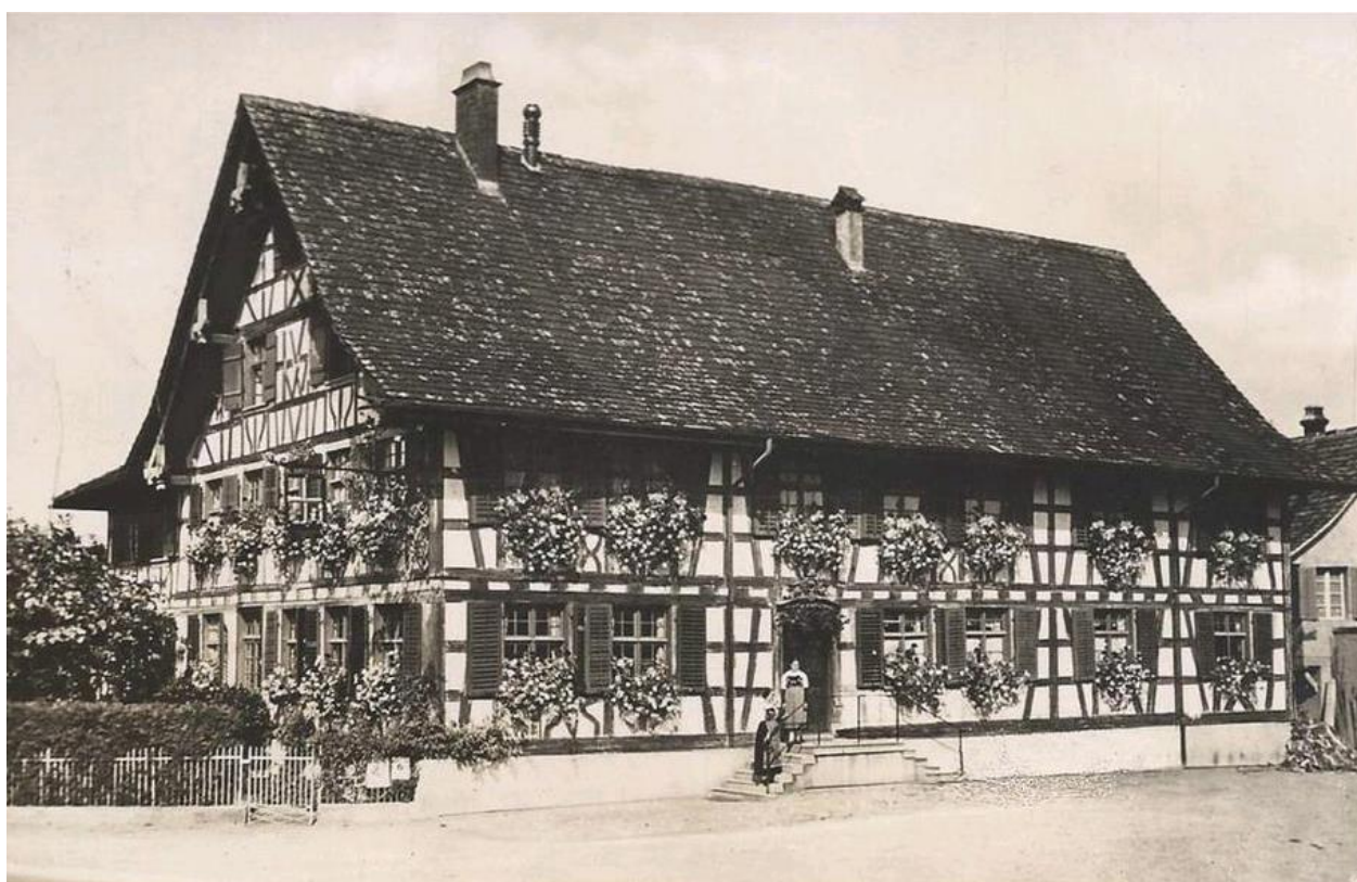
Gasthof Zum Goldenen Kreuz im Jahre 1930

DIE PREISE SIND IN CHF INKLUSIVE 7,7% MWST.