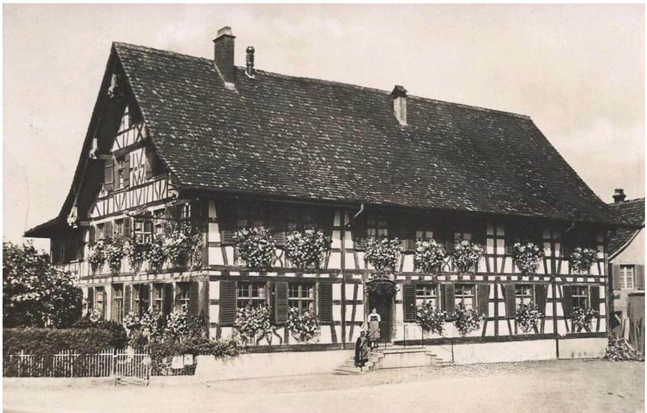
Gasthof Zum Goldenen Kreuz im Jahre 1930

DIE PREISE SIND IN CHF INKLUSIVE 7,7% MWST.